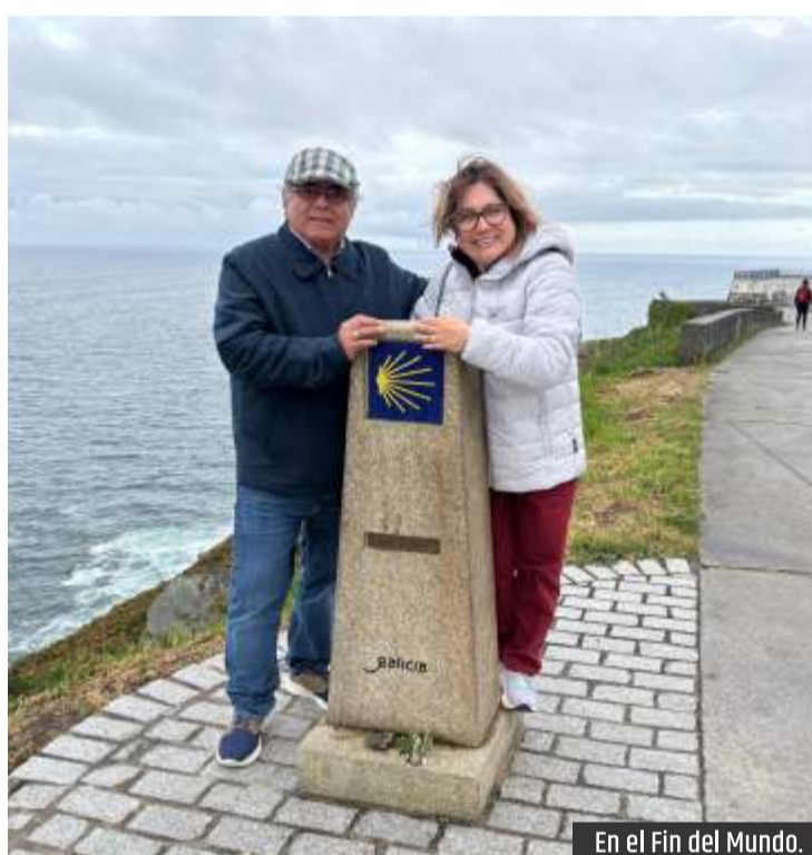
En el Fin del Mundo.

Y entonces aparece la memoria. No como recuerdo voluntario, sino como algo que el lugar activa. Santiago no distingue entre quien llega por primera vez y quien regresa. A todos los coloca frente a lo mismo.