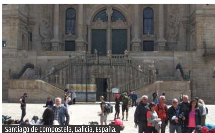
Santiago de Compostela, Galicia, España.

Caminarla es aceptar cierto desorden: fachadas irregulares, ropa tendida, esquinas que parecen improvisadas. Y, sin embargo, todo encaja. La Ribeira, de noche, es otra ciudad dentro de la ciudad. Las luces no iluminan tanto como subrayan. El Duero actúa como un espejo irregular donde los puentes se repiten con una precisión imperfecta. Desde el agua, todo cobra sentido. Lo que a pie es fragmento, desde el río es conjunto.