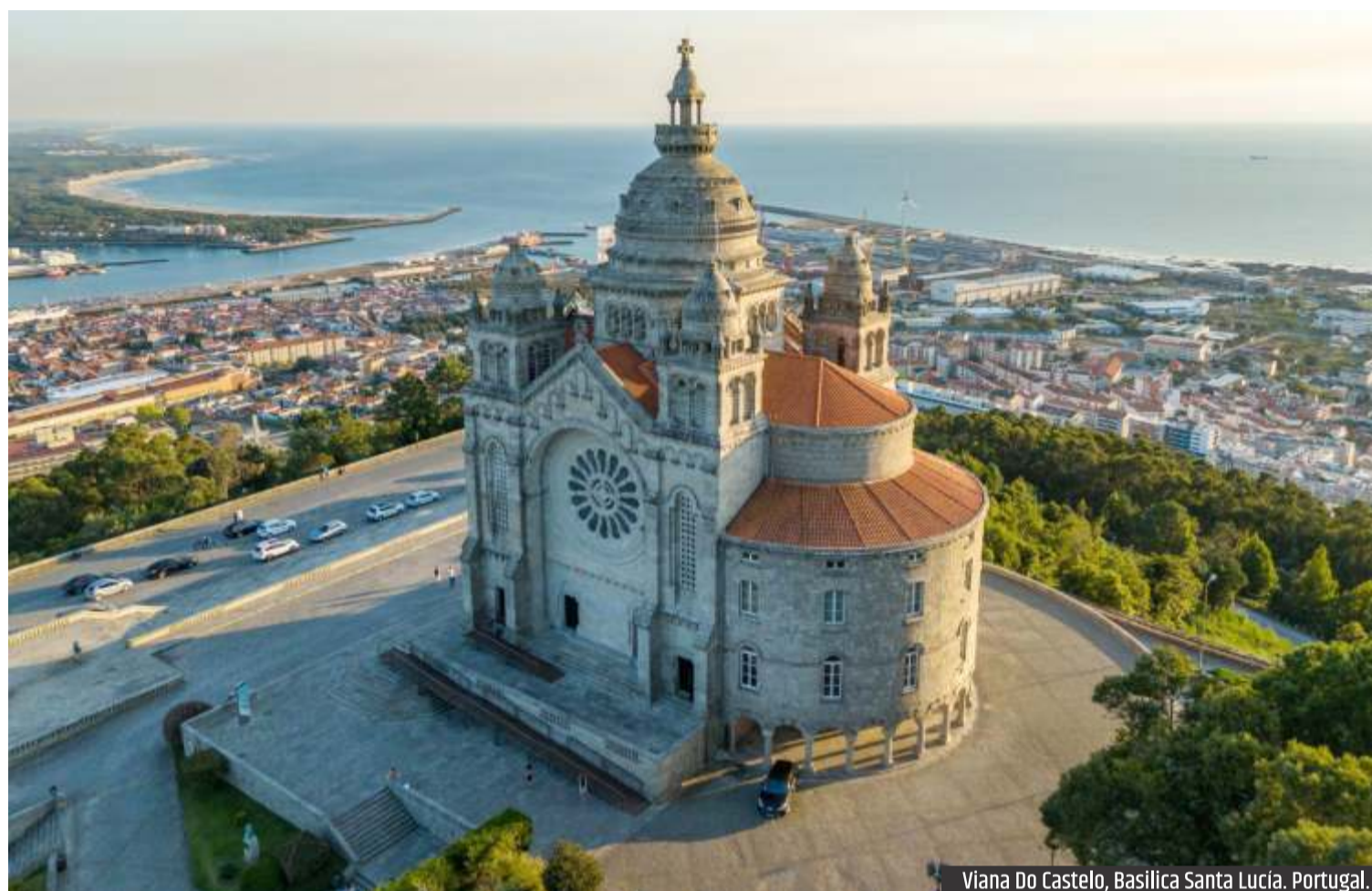
Viana Do Castelo, Basilica Santa Lucía. Portugal.

De día, el lugar es amplio, casi severo en su geometría. Pero es de noche cuando se transforma. La procesión de las velas no es un espectáculo, aunque podría parecerlo desde fuera. Es una acumulación de silencios encendidos.