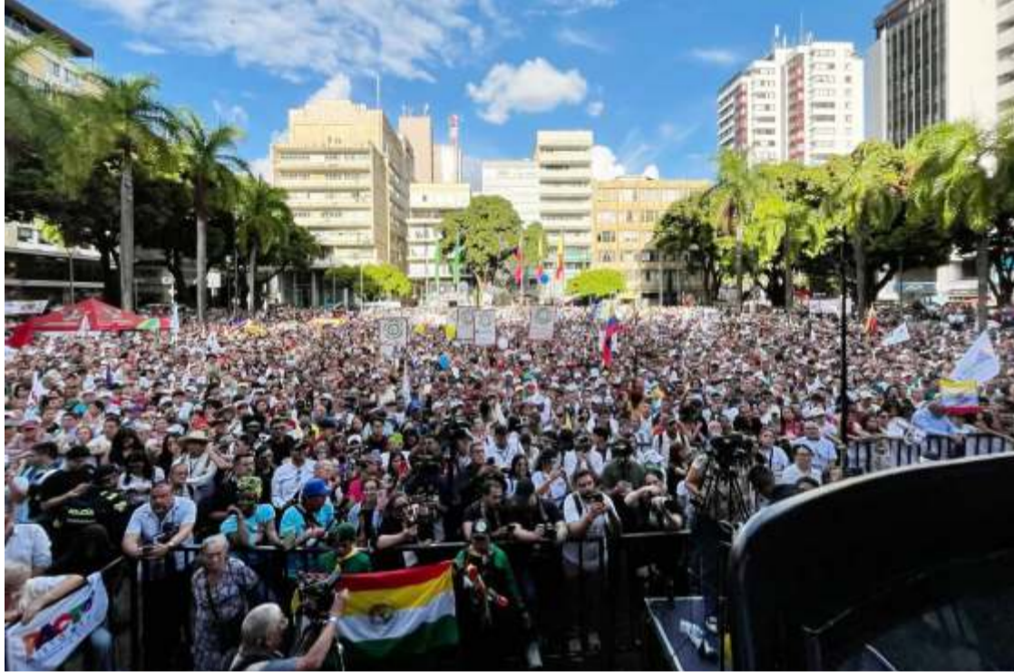
Con un lleno total de lado a lado, incluso a su alrededor, la fuente de Pereira acudió al llamado de Cepeda presidente. Sin buses sin refrigerios y sin empleados de ninguna entidad gubernamental el candidato del pacto histórico estuvo durante 4 horas en la imponente plaza de Bolívar. Miles y miles de simpatizantes acudieron al llamado para una Colombia sin ultraderecha, sin uribismo y sin FALSOS positivos. Elocuentes las imágenes.

A mediados del siglo XX, en una geografía marcada por profundas desigualdades rurales, miles de campesinos comenzaron a organizarse en defensa de condiciones de