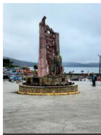
Fisterra - Monumento al inmigrante.

Como si, después de todo —Lisboa aplazada, Fátima interiorizada, Oporto recorrido, Vigo saboreado, Santiago recordado—, lo único que quedara fuera aceptar que hay lugares donde no se llega para entender, sino para quedarse, al menos por un instante, y que esa visión nos acompañe para siempre.