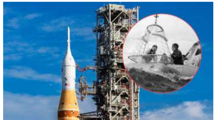
Trump resaltó el récord que habría roto Artemis II sobre el Apolo 13, con la distancia recorrida el día 6.

"Es un honor hablar con ustedes y quiero felicitarlos a cada uno", concluyó.