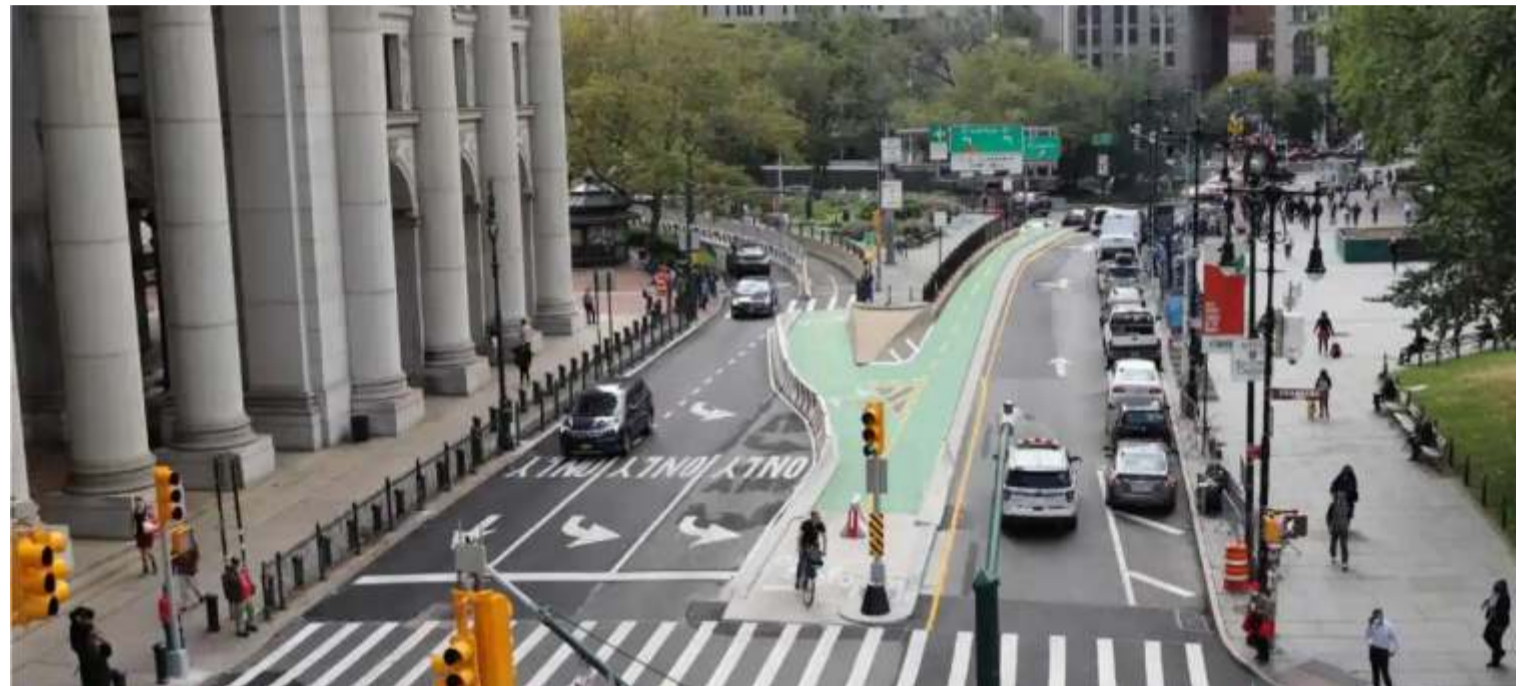
Diseño futuro de la entrada peatonal y ciclista del Puente de Brooklyn en Manhattan.

“Desde que asumimos el cargo, nuestra administración se ha guiado por una promesa sencilla: calles seguras y accesibles para todos los neoyorquinos”, declaró el alcalde Mamdani. “Ya sea que conduzca, camine o cruce el Puente de Brooklyn en bicicleta, usted merece llegar a su destino con facilidad y sin temor. Este nuevo diseño protegerá mejor a ciclistas y peatones mientras