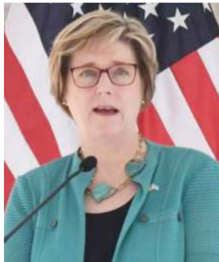
Laura Dogu, Embajadora de Estados Unidos para Venezuela