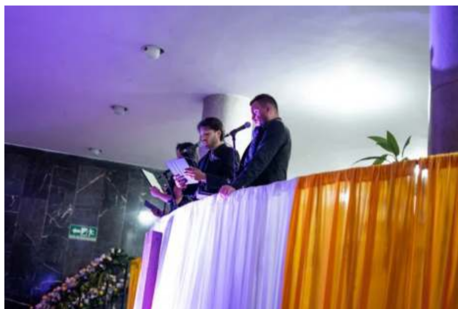
Semana Santa en Pereira 2026