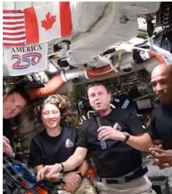
El presidente Donald Trump habló con los astronautas, felicitándolos y señalando que pronto el destino será Marte.

"Solo quiero que vayan a la parte de atrás de la Luna, la gente no ha estado allí por mucho tiempo, podemos decirlo, pero va a ser cada vez más relevante porque vamos a estar haciendo muchos viajes. Y luego, finalmente, van a hacer el gran viaje a Marte, y eso va a ser muy emocionante. Así que si miran, no hay astronauta que haya estado en la Luna desde los días del programa Apolo. El programa Apolo también fue muy especial, pero eso