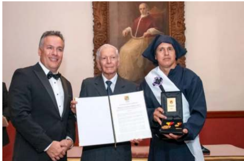
Honores al Papa León XIV