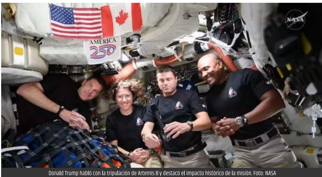
Donald Trump habló con la tripulación de Artemis II y destacó el impacto histórico de la misión.

Durante la jornada, los astronautas completaron con éxito pruebas clave del traje OCSS, verificando su funcionamiento, seguridad y movilidad en distintas condiciones. Además, la nave ingresó en la esfera de influencia lunar, el punto en el que la gravedad de la Luna pasa a dominar su trayectoria, un paso fundamental antes del sobrevuelo por la cara oculta del satélite.