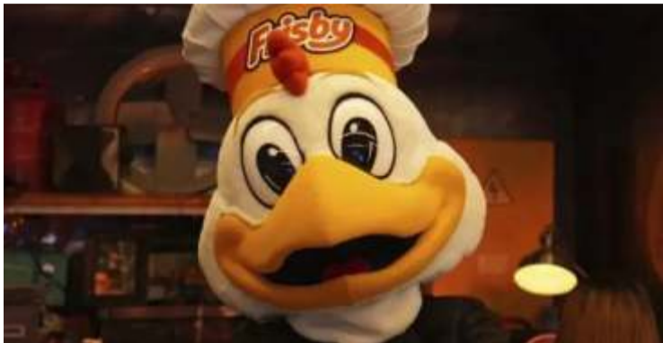
Por: Óscar Barrero Rodríguez (Valoraanalitic)

Frisby Colombia explicó lo que sigue tras el lío judicial con Frisby en España.